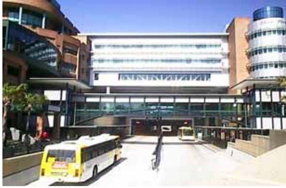
圖二 BRT 與聯合開發

世界許多城市都已經建置了公車捷運系統，積累了許多成功經驗。綜觀這些成功經驗，展望未來發展，公車捷運系統得以成為公共運輸系統新興發展的趨勢。具體之優勢包括：