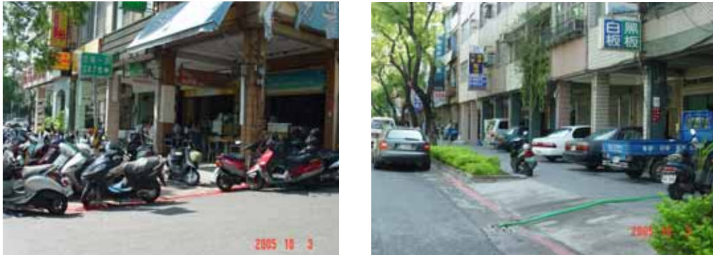
圖 2 本市人行道、騎樓違規停車情形

由於南台灣高溫炎熱之氣候，很多市民無法忍受在烈日下，步行搭乘大眾運具炙熱難耐之情形，又因本市騎樓、人行道之停車缺乏管制，無法提供安全、舒適步行環境與空間，致多數市民亦以騎乘機車取代步行，使本市機車持有率逐年成長。