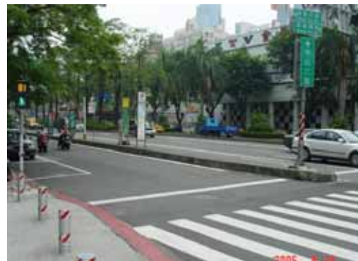
圖 4 本市中華路