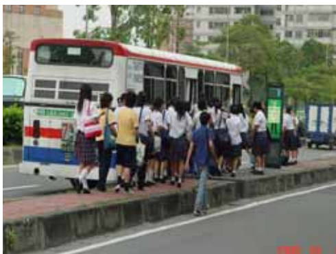
圖 3 本市民族路

本市民族路、中山路、中華路、民權路、民生路、四維路及青年路等 7 條道路公車站位設於分隔島上。而這些分隔島過高、過窄且乘客需穿越慢車道，又缺乏雨庇及護欄等設施，影響民眾搭乘公車之意願。